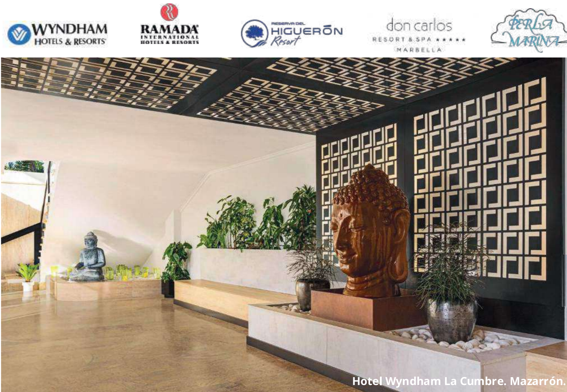
Hotel Wyndham La Cumbre. Mazarrón.

Desde la consultoría estratégica y el diseño hasta la ejecución y amueblamiento de reformas complejas orientadas al upgrade y reposicionamiento , nuestra experiencia abarca todas las tipologías de hoteles y la reconversión de edificios desde otros usos al hotelero.